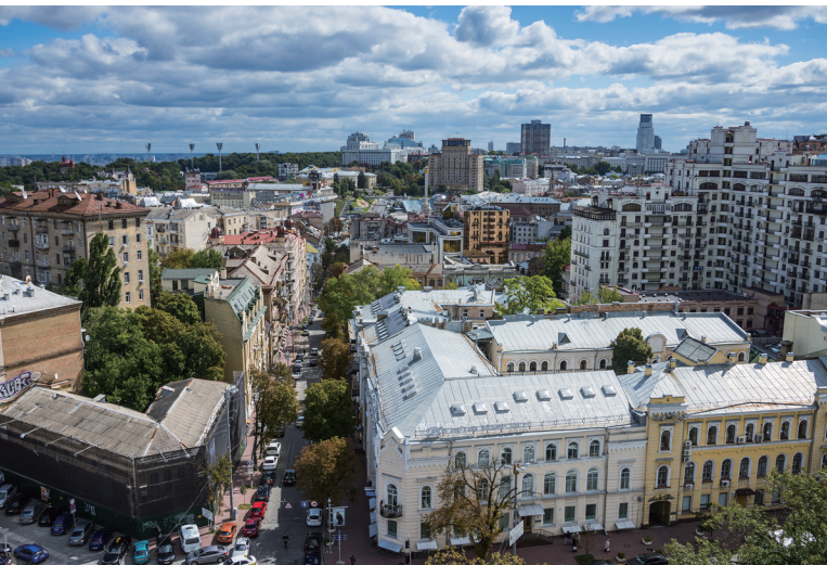
↑ 乌克兰首都基辅城市景观